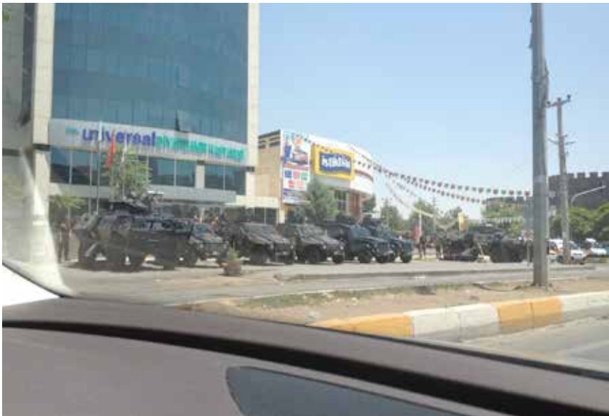
Polisiära fordon längs vägarna.