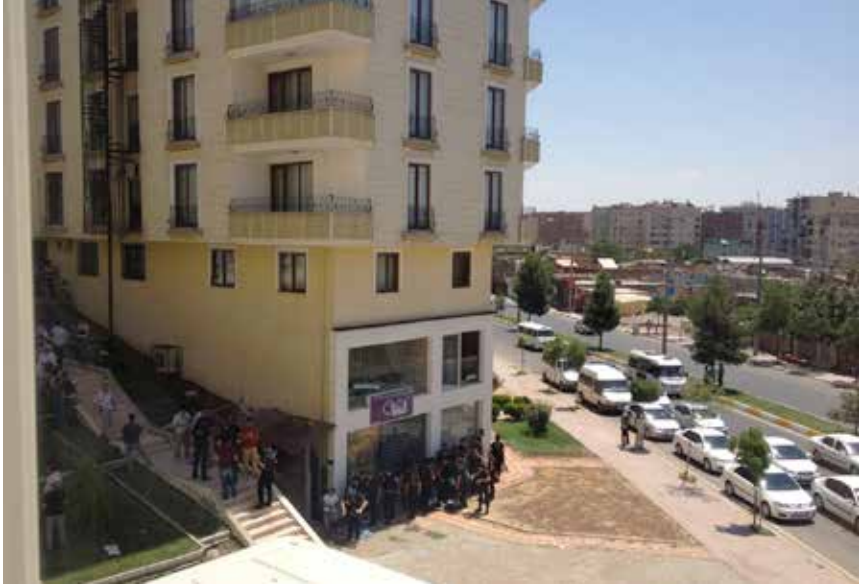
Utanför BDP's partihögkvarter står polis och inväntar order.