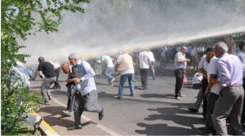
I samma stund som när folket söker skydd i moskén.