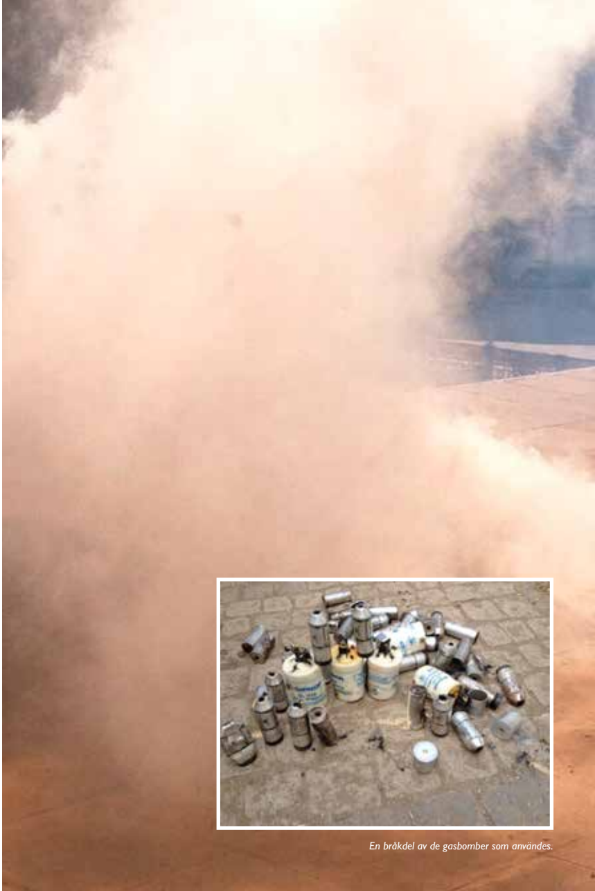
En bråkdel av de gasbomber som användes.