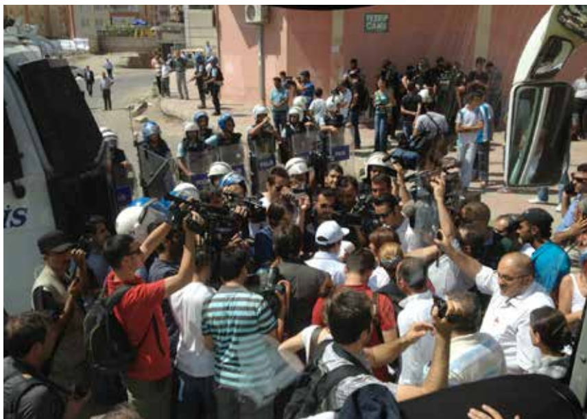
I samband med att vi fick lämna bussen.

När vi sedan skulle lämna partihögkvarteret och bege oss till samlingsplatsen med övriga från BDP:s partistyrelse, var vi förstås lite spända. Vad skulle hända? Skulle polisen och militären försöka stoppa oss? Vi satte oss i en buss som skulle ta oss till samlingsplatsen men kom inte ens fem meter innan vi var omringade av pansarbilar och vattenkanonbilar. Partiledningen försökte tala med polisen men det var lönlöst. De släppte inte fram oss. Det togs då ett beslut om att vi gående skulle ta oss till samlingsplatsen.