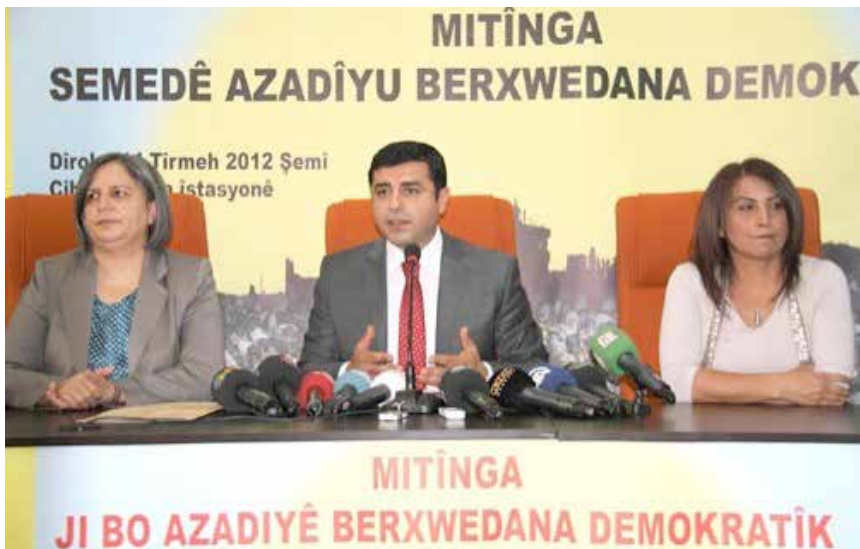
Från höger BDP's språkrör Gulten Kisanak, BDP's språkrör Selhattin Demirtas och DTK's språkrör Aysel Tugluk.

Utifrån mänskliga rättigheter om rätten att få uttrycka åsikter och rätt att samlas, var det alltså inte märkligt att BDP och DTK ändå beslutade sig för att genomföra demonstrationen. Vilken annan väg finns om man konsekvent alltid nekas denna rätt. För oss var det självklart att även gå med i demonstrationen och då framförallt för att visa vårt stöd för deras rätt att få demonstrera. En rätt ingen ska kunna fråntas!