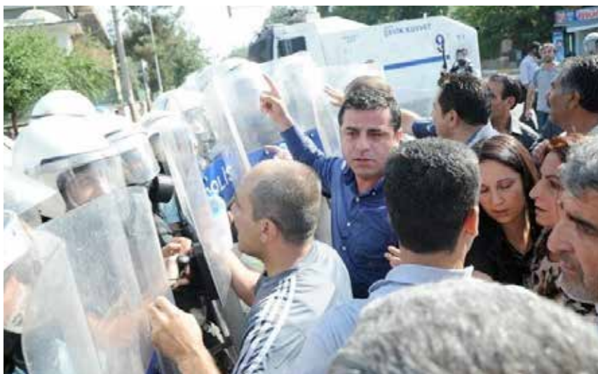
Stoppas efter 100 meter från partilokalen.

Det blev då och då ett tryck fram mot polisen, som tryckte tillbaka demonstranterna. Hela tiden fanns två poliser redo att kasta in tårgasgranater bland demonstranterna. I den ena handen höll de granaten och i den andra handen vilade pekfingeret på sprinten till den. Det kom vid detta tillfälle aldrig till en situation där de släppte lös tårgasen men vi misstänkte redan då att det inte var sista gången vi sett tårgasgranater.